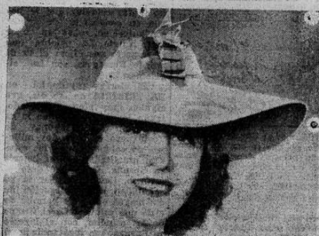
"INSPIRACION" Capeline de fieltro amarillo gros-grain violeta y amarillo. Creación Louise Bourbon.

Para el torneo de esta noche existe muchísimo entusiasmo entre la afición de Alajuela y de esta capital.