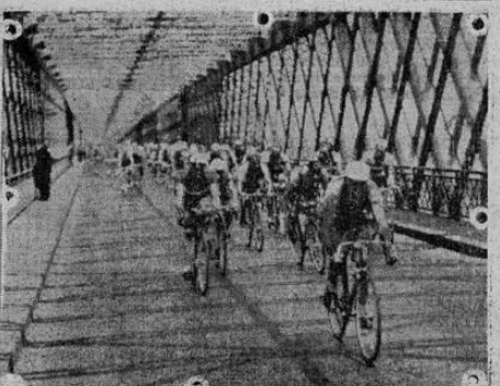
La vuelta a Francia en bicicleta. El paso de los ciclistas por el puente de la Roche Bernard.

por mucho tiempo al Estadio Nacional. Hemos de agregar, que los dos equipos se encuentran en muy buenas condiciones de training, así como la integración será muy buena; tomarán parte en este evento los jugadores titulares de ambos clubs, por lo que a no dudarlo este será uno de los más interesantes y reñidos encuentros del campeonato de 1933. Arbitrará el encuentro don Bernardo Castro, y los guardalíneas serán designados por el referee.