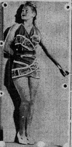
PETIT COMBINE vestido short de playa formado de dos pañuelos rojo y blanco. Creación Eres

Telefónicamente se nos informó esta mañana por parte de numerosos vecinos del distrito de Catedral, que dicho sector no cuenta con agua desde hace algún tiempo para acá. Al referirnos de este asunto, también se nos dijo que las quejas a la Municipalidad habían sido constantes en vista de la privación de agua, no habiendo más respuesta que no se podía hacer nada sobre el asunto. El caso es lamentable ya que de ejemplo sirvió el caso reciente cuando un tubo madre se rompió dejando a toda la capital sin agua por término de muchas horas. Pues bien, el caso fue objeto de lamentos de todos los capitales y es así como ahora creyéndose que todo marcha bien — esto en cuanto a los desperfectos de la tubería — cabe la queja de los vecinos del distrito de Catedral. Del mismo modo, esperan ser atendidos por esta vez, ya que otras no lo han sido.